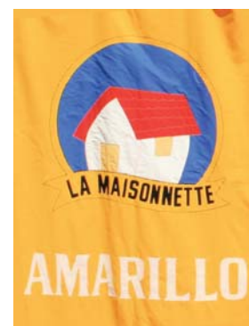
Carolina Figueroa Jefa Color Amarillo 8/9225827